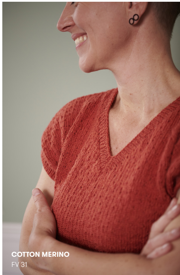
COTTON MERINO FV 31